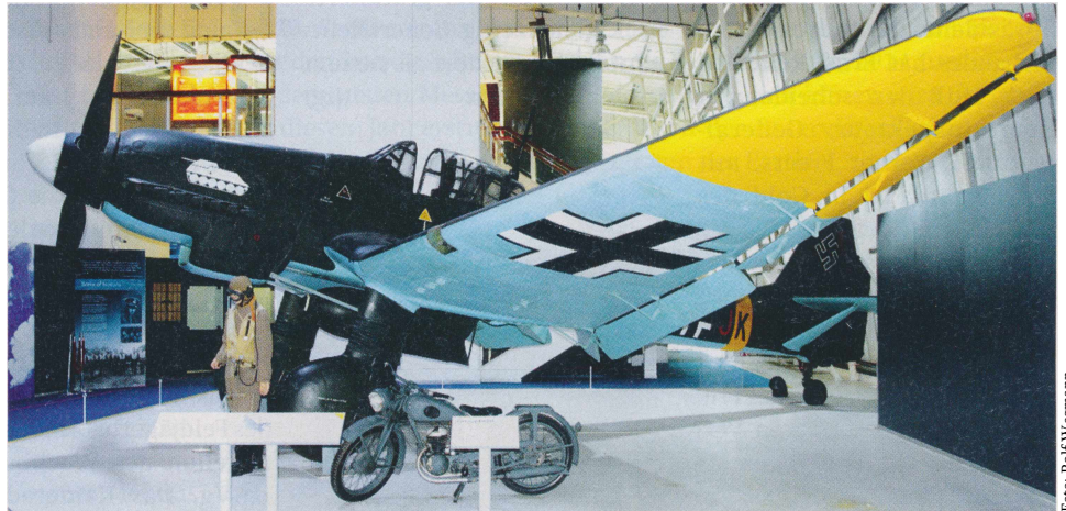
Der Stuka von Hendon ist eines von nur noch zwei Exemplaren der Junkers Ju 87 (Sturzkampfbomber, Tiefdecker mit Knickflügeln, starrem Fahrgestell und zwei Mann Besatzung), die heute weltweit im Originalzustand zu sehen sind