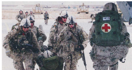
Der Afghanistan-Einsatz konfrontiert die Soldaten mit Verwundung und Tod

Der Autor beschreibt in seinem Buch das Schicksal und den persönlichen Kampf eines deutschen Soldaten während und nach dem Bundeswehr-Einsatz in Afghanistan. Dort wurden 2002 fünf Soldaten bei einer Raketenexplosion getötet, er selbst überlebte, nur durch Glück, schwer verletzt. Nun ringt er gegen Desinteresse und Ignoranz von Politik und Gesellschaft in Deutschland.