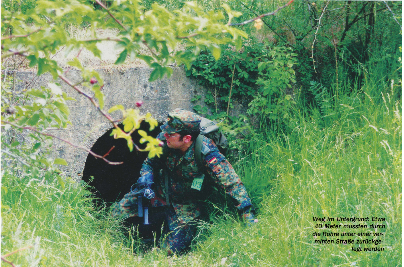
Weg im Untergrund: Etwa 40 Meter mussten durch die Röhre unter einer verminten Straße zurückgelegt werden