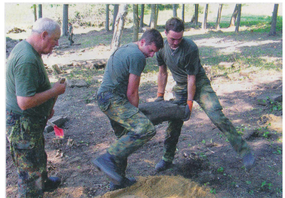
Zwei junge Reservisten legen auf Anweisung eines älteren erfahrenen Reservisten die Grabplatten in den Sand

Zusammen mit dem Verteidigungsattaché legten die Ertinger am Ende ihres Einsatzes ein Blumengebinde am Denkmal nieder.