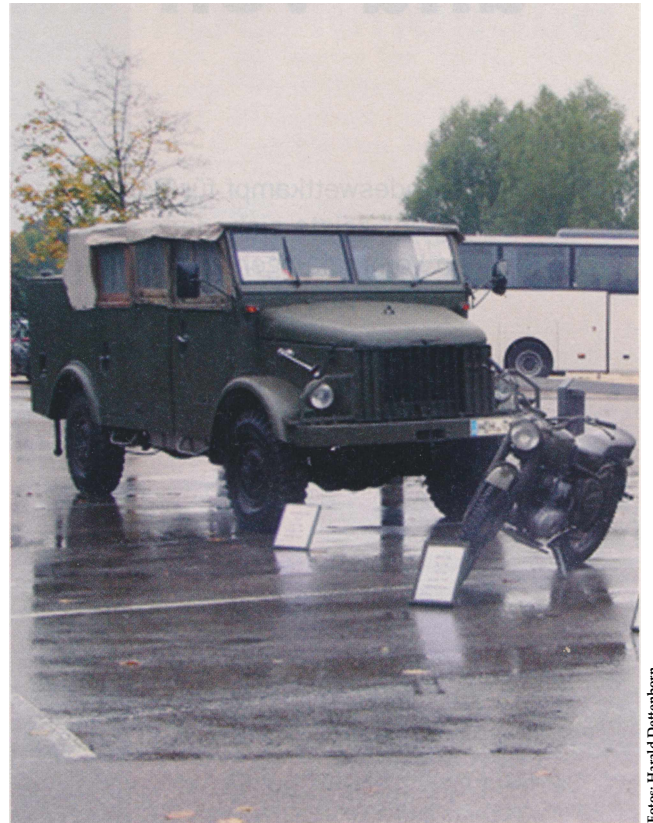
Reservisten aus Giengen an der Brenz präsentieren historische Fahrzeuge der Bundeswehr