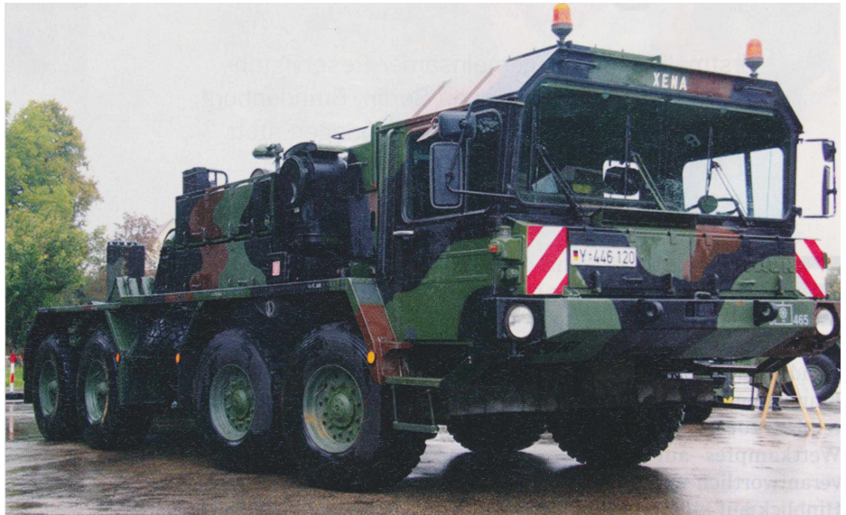
Der Schwerlasttransporter „Elefant“ der Bundeswehr

In der Ellwangener Innenstadt beging die Landesgruppe Baden-Württemberg ihren „Tag der Reservisten“. Zahlreiche Bürger nutzten das breit gefächerte Informations- und Mitmach-Angebot