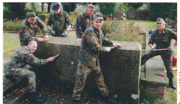
Mit Dampfstrahler, Drahtbürste und Muskelkraft reinigten Mitglieder der Reservistenkameradschaft Trossingen vermooste Kriegsgräber und Denkmäler auf dem heimischen Friedhof