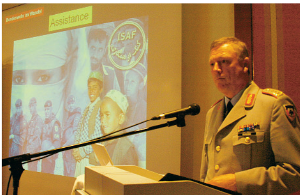
Zur Macht der Worte die Macht der Bilder: Parallel zu seinem Vortrag ließ Generalleutnant Jan Oerding eine Bildfolge zu „Bundeswehr im Wandel“ ablaufen

„Im Zeichen der Globalisierung gehen eben nicht nur Nachrichten ohne Zeitverzögerung um die Welt, fließen nicht nur Güter ‘just in time’ um den Erdball – auch Konflikte sind schon lange nicht mehr lokal oder regional einzudäm-