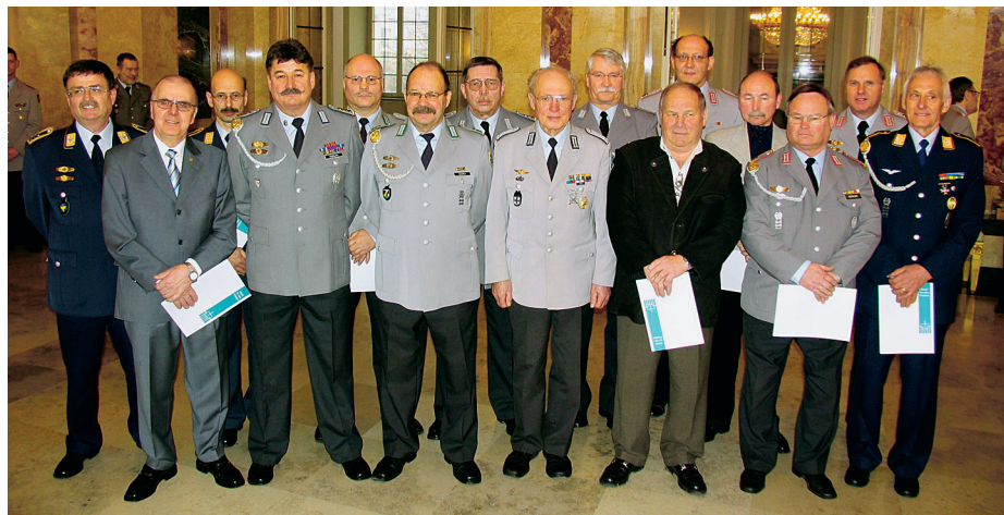
Auszeichnungen für Reservisten: Etwa die Hälfte der Spendensumme sammelten Reservisten, deren erfolgreichste Sammler hier ausgezeichnet wurden.