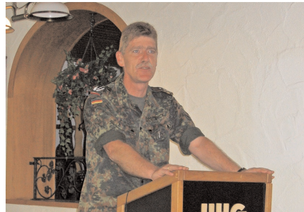
Oberst i.G. Thomas Pottrick erläuterte beim sicherheitspolitischen Seminar der Bezirksgruppe Südwürttemberg-Hohenzollern in Sigmaringen die derzeitige Lage und den Auftrag der 10. Panzerdivision.

Die Reduzierung der Streitkräfte zum „Neuen Heer“ erfolgt überwiegend durch Auflösung von aktiven und nichtaktiven Truppenteilen - inklusive der Umgliederung des Stabes der 10. PzDiv bis 2008.