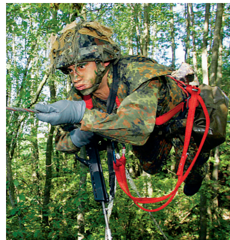
Über eine Schlucht ging es an der Station Seilsteg.