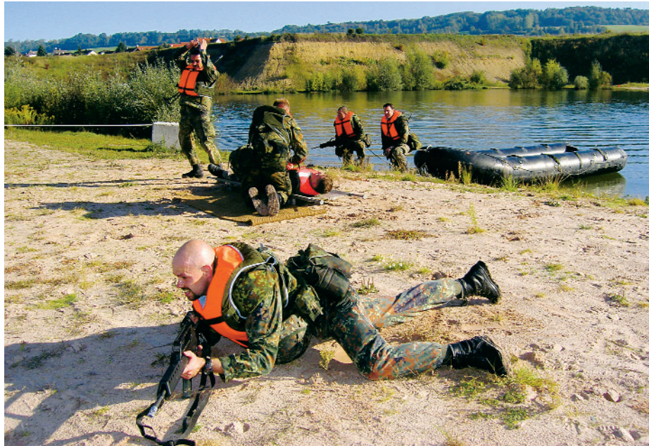
Erst mit dem Schlauchboot über den See und dann Bergen eines Verletzten.

„Und fahrn“ schallte es denn aus dem Mund des militärischen Führers der Gruppe an der Station Retten und Bergen im Fahrt aufnehmenden Schlauchboot über den See. Ausgangslage: Ein Pionier war beim Minenräumen verwundet und