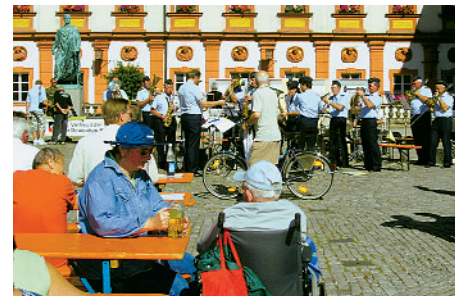
Bei militärischen Klängen ließen sich die Gäste den Eintopf schmecken.