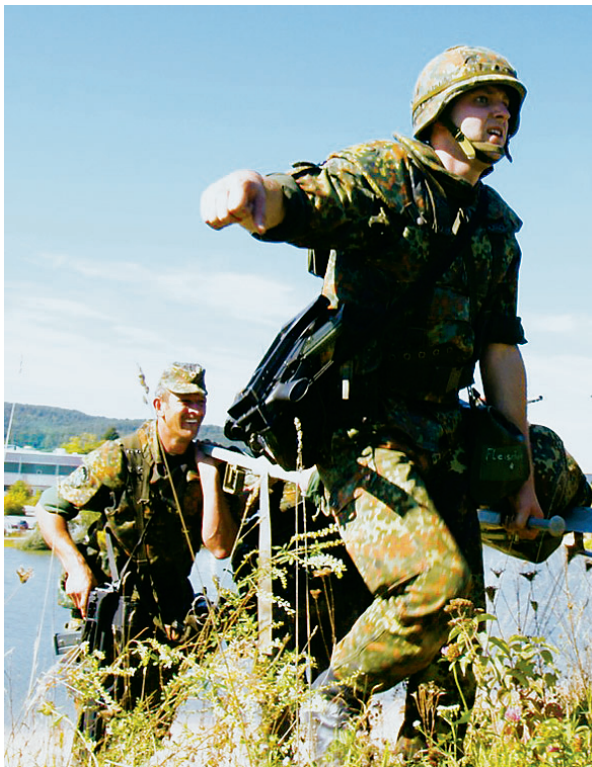
Große Anstrengung auch beim Transport zum Verwundetensammelpunkt.

Lösen einer sicherheitspolitischen Aufgabe sorgten bei allen Teilnehmern für volle Anspannung, dennoch absolute Konzentration und zur Aufgabenerfüllung notwendigen Bereitschaft, im Team unter großem Zeitdruck bestmögliche Leistungen zu erzielen. Die Prüfinhalte insgesamt bezogen sich vor allem auf solche des Erweiterten Aufgabenspektrums der Bundeswehr und die Unterstützung in der Katastrophenhilfe, die so genannte Zivil-militärische Zusammenarbeit.