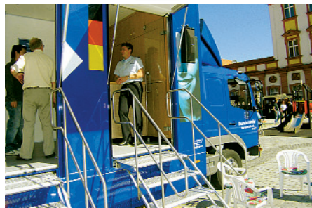
Auch die Wehrdienstberatung gehörte beim Tag der Reservisten dazu.