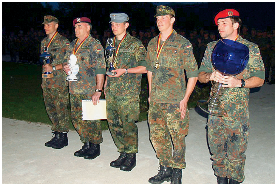
Die siegreiche Mannschaft Oberbayern I.