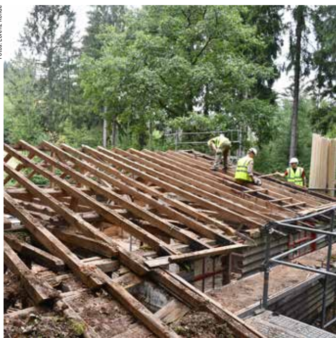
Britische Pioniere erneuern bei einem Arbeitseinsatz den Dachstuhl einer Lagerhütte im Odenwald bei Eberbach am Neckar