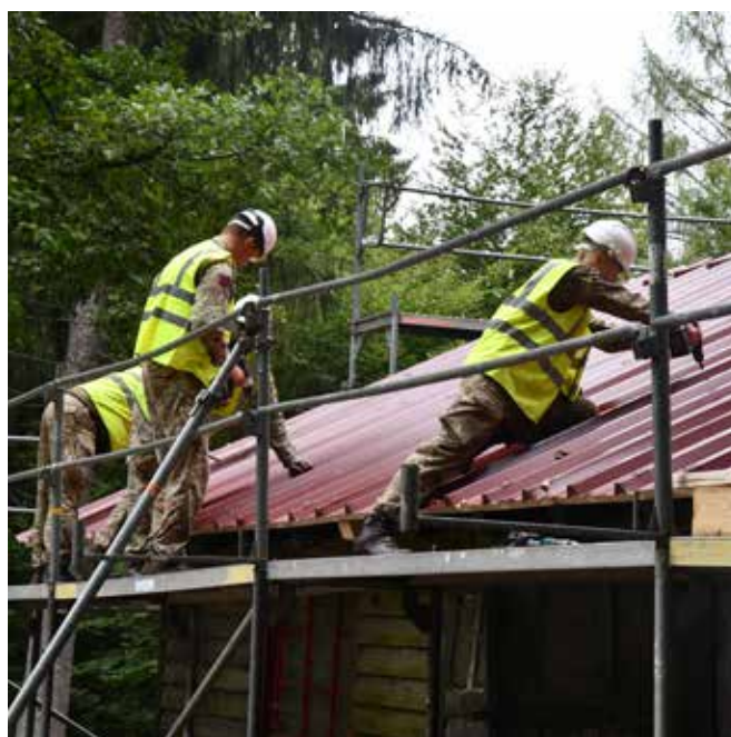
Wie beim Einsatz im Felde ist nicht allein gegen Regen zu sichern, sondern auch gegen Wind