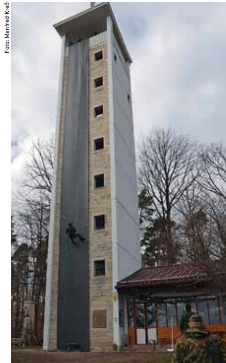
„Immer auf dem Teppich bleiben“ erhielt beim Abseilen eine gänzlich neue Bedeutung, da die Außenfassade des neunstöckigen Uhlbergturms gegen Fußabdrücke mit einem Teppich geschützt wurde

In einem neu ausgewiesenen militärischen Sicherheitsbereich ist eine Personenkontrolle eine etwas diffizilere Angelegenheit, verglichen mit einem eingezäunten