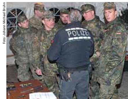
Kein Verhör, aber einen Fragebogen gab es an der Station Polizei zu den ausgelegten Dienstgradabzeichen der Polizei und verschiedenen Waffen

Kasernengelände. Dies zeigte sich an der Station „Personenkontrolle“. Wobei erschwerend hinzukam, dass es sich bei den verdächtigen Personen um ein Pärchen handelte und der Mann nicht nur eine Tarnjacke mit aufgenähter Blutgruppenbezeichnung trug, sondern auch ein „südländisches“ Aussehen hatte und sich nicht ausweisen konnte. Die Körperpervi-