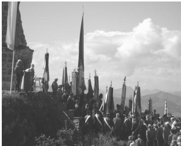
Das Ehrenmal auf dem Grünten mit den Fahnenabordnungen am 54. Grüntentag