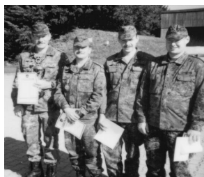
Das Team der RK Ertingen siegte beim Qualifikationsschießen der Bezirksgruppen Stuttgart und Tübingen des Reservistenverbandes.

Spannende Wettkämpfe wurden bei bester Witterung auf der Standortschießanlage in Sigmaringen geboten, als die Bezirksgruppen Stuttgart (VBK 51) und Tübingen (VBK 54) dort ihr Qualifikationsschießen mit G3 und P1 austrugen. 19 Reservistenmannschaften rangen um die Auszeichnungen. Siegermannschaft wurde das Team der RK Ertingen, den 2. Platz erreichte Esslingen vor Kirchheim/Teck.