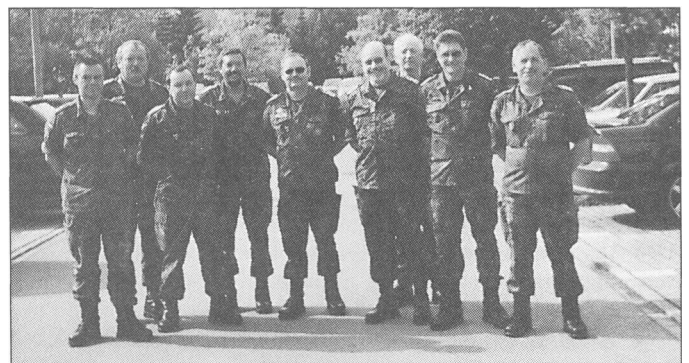
DAS FOTO ZEIGT alle Beteiligten der Weiterbildungsmaßnahme innerhalb der Kaserne in Sonthofen