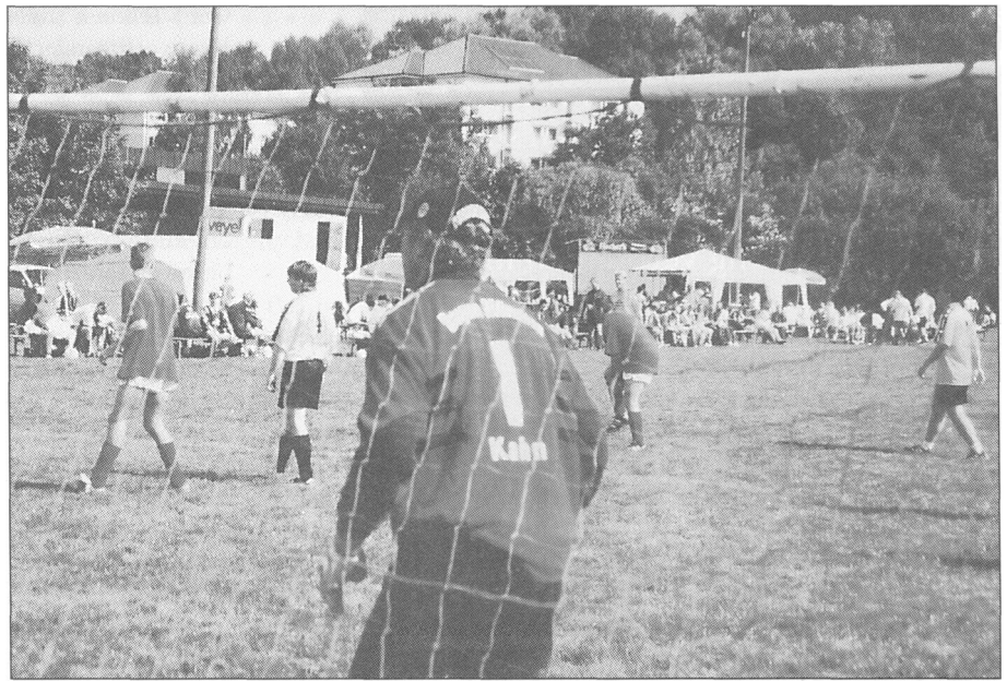
NICHT GANZ ANSCHLIESSEN an den Erfolg ihrer großen Vorbilder konnte der »F.C. Bayern Fun Club« aus Böttingen.

Herrliches Wetter und ausgezeichnete Fußballer waren am Himmelfahrtstag der Garant für ein gelungenes Fußballturnier der RK Steinlach-Wiesaz. Gäste und Fans der teilnehmenden Mannschaften hatten sich bereits früh um acht Uhr eingefunden, um auf dem Mössinger Hegwiesen-Sportplatz für eine ausgelassene Stimmung zu sorgen. In insgesamt 25 Vorrundenspielen wurden die Begegnungen für die Finalrunde ermittelt, wobei teilweise die Tordifferenz entschied. In einem ausgeglichenen und spannenden Finale im Siebenmeter-Schießen wurde der Turniersieg entschieden. Der 14. Siebenmeterschuss brachte die Entscheidung zu Gunsten der »Midnight Soccers« aus Gönningen, die somit den etwas glücklicheren »Fuß« hatten und gegen die »Nobody-Kickers« gewannen. Aus den Händen von »Turnier-Vater«, Fw d.R.