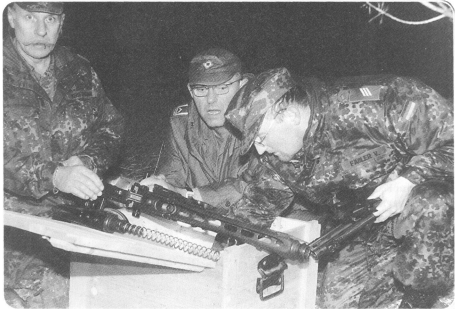
EIN TEAM der Reservistenkameradschaft Ravensburg beim nächtlichen Waffendrill anlässlich des Militärwettkampfes »Pfiffiger Jäger«.