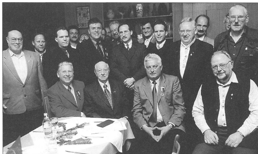
»MÄNNER DER ERSTEN STUNDE« ehrte die Reservistenkameradschaft Albstadt bei einer Jubiläumsfeier an der Schwelle zum Jahr 2000.