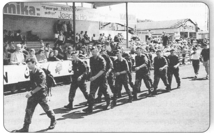
AUF DEM WEG INS ZIEL: Die deutsche Marschgruppe beim Einmarsch ins Stadion von Viborg.

vom Start weg wolkenfreier Himmel, was einen heißen Tag versprach. Unbeirrt von der Hitze legten die Marschierer Kilometer für Kilometer hinter sich, wobei mehrere ausländische Marschgruppen mit Gesang überholt