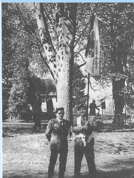
MIT EINER FAHNENABORDNUNG waren Reservisten des Reutlinger Reserve-Unteroffiziercorps bei der »Camerone« der Fremdenlegionäre in Tübingen vertreten.