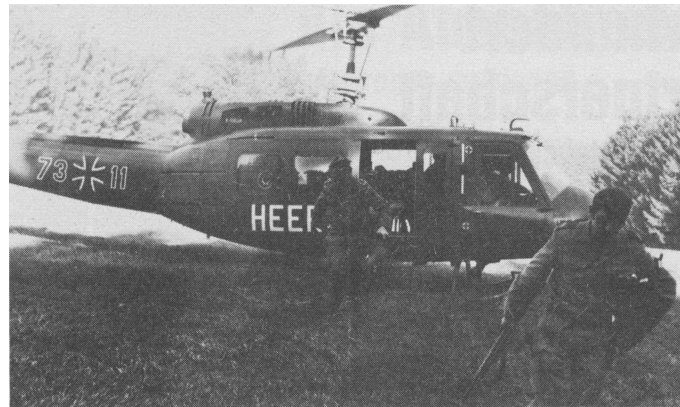
»Hochburg I«: Die Trupps verlassen am Absatzpunkt den Hubschrauber