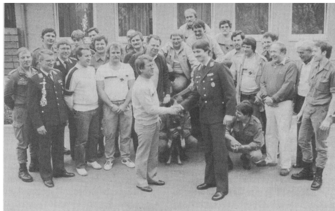
Die Heubacher Reservisten und die Soldaten vom 8. Fernmelderegiment 12 bei ihrem ersten offiziellen Freundschaftstreffen. Die RK will künftig mit den Soldaten Grillpartys und andere Geselligkeiten veranstalten.