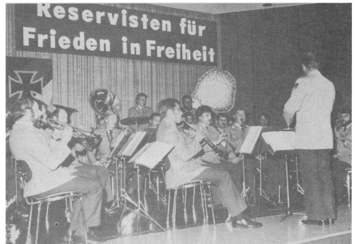
»Reservisten für Frieden in Freiheit« — unter diesem Motto stand der Landesdelegiertentag 1983. Das Reservisten-Musikkorps Bodensee-Oberschwaben umrahmte die Abschlusssveranstaltung in der Schwabenlandhalle in Fellbach.