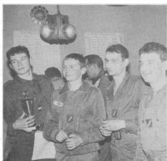
Die siegreiche französische Mannschaft von der RC 11 e Escadron aus Kaiserslautern.