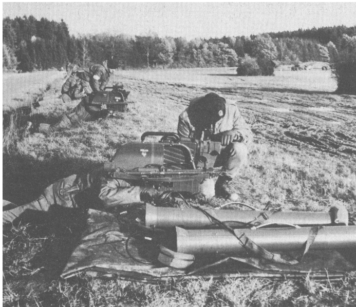
Reservisten bei der Schießausbildung mit dem Panzer-Abwehr-Raketensystem MILAN auf dem Standortübungsplatz Haisterhofen.