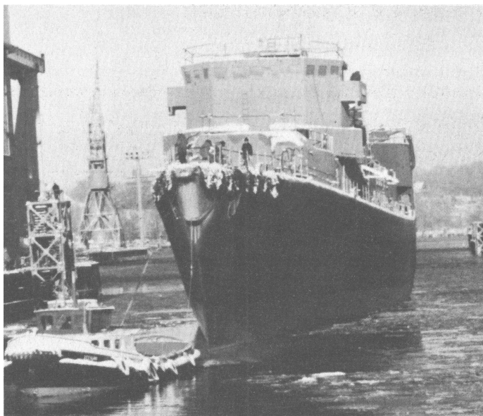
Die neue KARLSRUHE, vorerst letzter Neubau der Fregatten der Klasse 122.

TUTTLINGEN (JS) — Rund 20 Reservisten der RK Tuttlingen, Spaichingen und Trossingen trafen sich auf dem Segelflughafen Klippeneck zu einer Einweisung als Luftbeobachter. Zwei Hubschrauber des Typs Bell UH ID vom Heeresfliegerregiment 20, Neuhausen ob Eck, waren dazu bereitgestellt. Nach einem Unterricht über die Aufgaben eines Luftbeobachters ging es in die Luft. Die Reservisten sollten versuchen, die Flugstrecke auf der Karte mitzuverfolgen und den nördlichsten Wendepunkt der Flugroute zu ermitteln. Der Vorsitzende der RK Tuttlingen, Hptm d.R. Alles, bedankte sich im Namen aller Teilnehmer bei den Piloten.