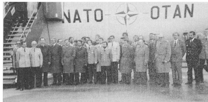
Die Teilnehmer des AKRO Bezirksgruppe Freiburg beim Besuch von AWACS, korrekterweise — weil so befohlen — alle ohne Kopfbedeckung.

KONSTANZ/IMMEMDINGEN — Die RK Konstanz feiert am 10. und 11.9.1988 ihr 25jähriges Bestehen. Am 27. und 28.5.1988 findet im Immemdinger Raum die Übung PEGASOS der Kreisgruppe Schwarzwald-Baar-Heuberg statt.