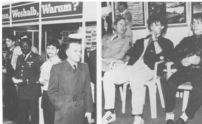
Mit großem Erfolg präsentierte sich die NATO wie in den Vorjahren mit einem Informationsstand auf dem Mannheimer Maimarkt 1985, bei dem über 400000 Besucher gezählt wurden. Unsere Fotos zeigen den mit alliierter Soldaten besetzten Stand mit Generalmajor Brugmann (Befehlshaber Territorialkommando Süd, rechtes Bild) und mit Generalmajor Odendahl, dem Chef des Stabes CENTAG (linkes Foto).

Bleibt nachzutragen, daß sich die Reservisten nach der Rückkehr spontan entschlossen, jedes Jahr für vier junge Wehrpflichtige der Schnellbootbesatzung die Fahrtkosten in Höhe von insgesamt 800,- DM zu übernehmen und ihnen damit den Besuch der Patenstadt Pforzheim zu ermöglichen.