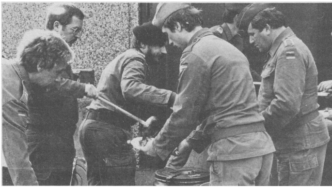
Ein warmes Essen nach dem KALTEN MARSCH ließ die Strapazen der langen Nacht rasch vergessen.