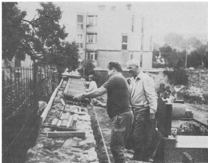
Konstanzer Reservisten bei der Erneuerung des Friedhofes in Boulay.