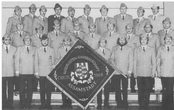
Gruppenbild mit Fahne: Mit einer zweitägigen Veranstaltung feierte die RK Assamstadt ihre Fahnenweihe. Die kirchliche Weihehandlung wurde anlässlich eines feierlichen Hochamtes vorgenommen. Bei dem anschließenden Festakt in der Stadthalle wurde die Partnerschaft mit der Nachschubkompanie 360 aus Bad Mergentheim besiegelt.

die Göppinger Reservisten, die für die Teilnahme jedesmal einen Urlaubstag opfern. Sieger war die Mannschaft des Gebirgs-Sanitätsbataillons aus Kempten. Die RK Göppingen konnte nur einen mittleren Rang belegen. Einzelsieger wurde Polizeimeister Mangold vom Sondereinsatzkommando (SEK) Baden-Württemberg.