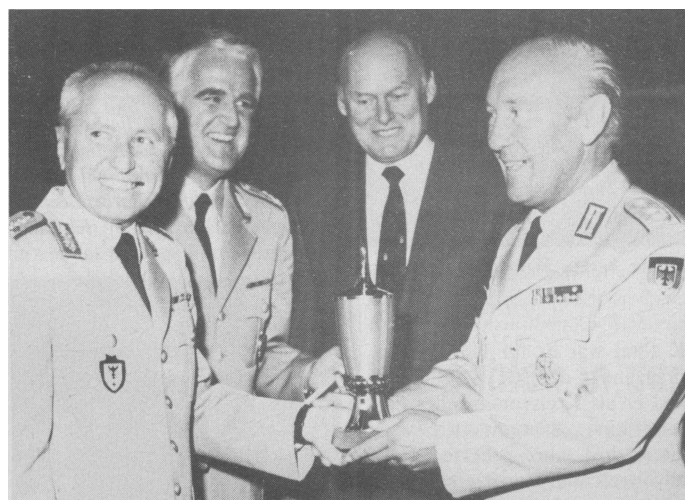
»Er zeigt's den jungen Hüpfern«, schrieb die »Bild«-Zeitung über den Sieg Otto Stages bei den Reservisten-Sportwettkämpfen. Es gratulierten (von links): Generalleutnant Kasch und die Landesvorsitzenden Ziegler (Baden-Württemberg) und Benner (Bayern), der zugleich Sportbeauftragter des Reservistenverbandes ist.

Die Veranstaltung, die vom Reservisten-Musikkorps Bodensee-Oberschwaben musikalisch umrahmt worden war, klang mit der gemeinsam gesungenen Nationalhymne aus. Bei einem anschließenden Eintopfessen in der GENERAL-REINHARDT-Kaseme sorgten die Reservisten-Musiker — zeitweise unter der Stabführung von General Kasch — für gute Unterhaltung.