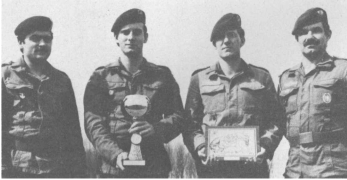
Die RK Offenburg stellte die Siegermannschaft bei der Militärpatrouille der Kreisgruppe Südlicher Oberrhein.