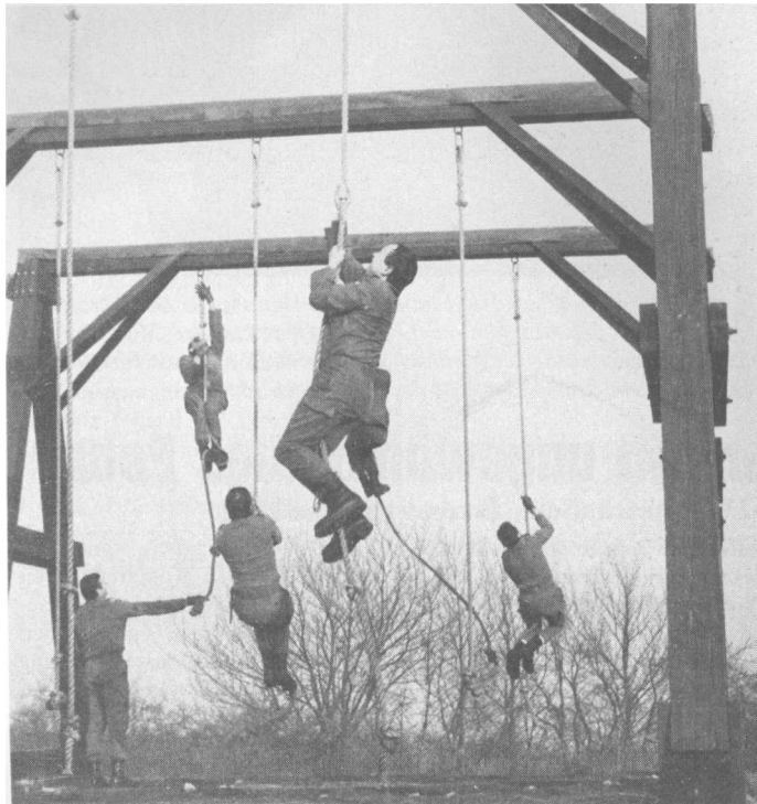
Um die Wette am Seil in die Höhe. Das war eine der Aufgaben bei der Kreismilitärpatrouille der Kreisgruppe Mittlerer Neckar Süd in Nagold.

Nach dem gemeinsamen Mittagessen wurden zwei Filme gezeigt sowie der Auftrag der Sicherungsstaffel erläutert. Den Abschluß bildete in der UHG eine Diskussion mit allen »Betreuern«.