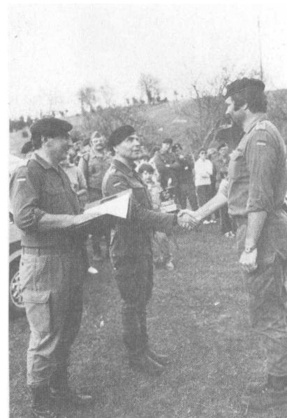
Schnappschüsse vom 13. Internationalen Donau-Waffenlauf: Auf der Strecke und bei der Siegerehrung.