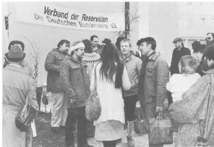
Wie ein Magnet wirkte der Infostand der RK Schwäbisch Gmünd. Diskussionen mit Blockierern aus dem nahegelegenen Mullangen wurden fair und sachlich geführt.