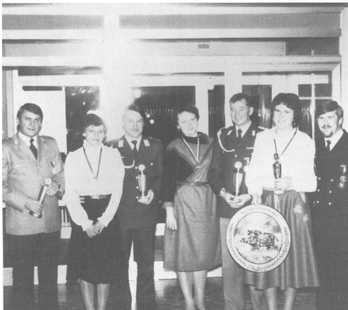
Ehrung verdienter Mitglieder der RK Immendingen