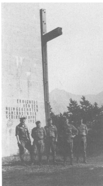
Eine Schießmannschaft der RK Böblingen nahm erfolgreich am 5. Internationalen Minuteman-Schießwettbewerb, an dem 32 Mannschaften aus neun NATO-Staaten mitgewirkt haben, in Mittenwald teil. Im Anschluß besichtigte die Mannschaft das Gebirgsjägerdenkmal in Mittenwald (Foto). Der Tag klang mit der Siegerehrung und einem Festbankett in Garmisch-Partenkirchen aus.