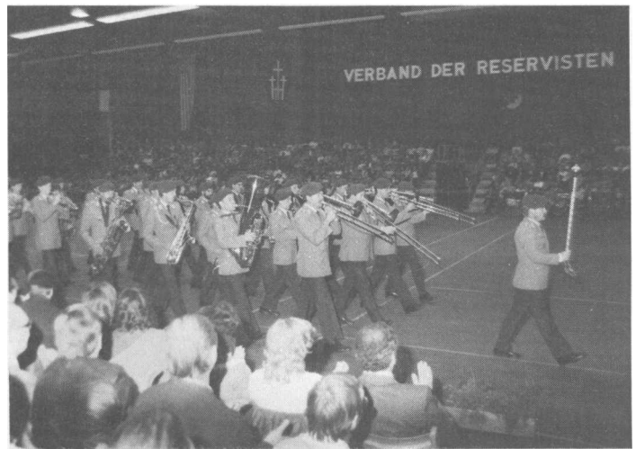
Das Heeresmusikkorps 9 bei der 1. Internationalen Militärmusik-Show in Böblingen.

WALDSHUT TIENGEN — Erfolg bei der Teilnahme am 5. Internationalen Schießwettbewerb in Tirol hatten die Mannschaften der RK-UOC Hoahrhein. Die Mannschaft II sicherte sich den 4. Platz unter den 18 teilnehmenden RK Mannschaften aus der Bundesrepublik und den 34. Platz der Gesamt-Wertung unter den 83 Mannschaften!