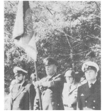
Ein Gottesdienst mit Fahnenweihe war der Höhepunkt der 20-Jahr-Feier der RK Konstanz.