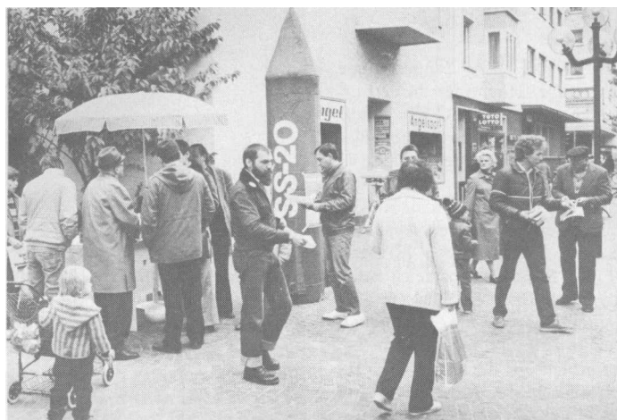
Für Frieden und Freiheit warben die Reservisten des Murgtals in der Gaggenauer Fußgängerzone.