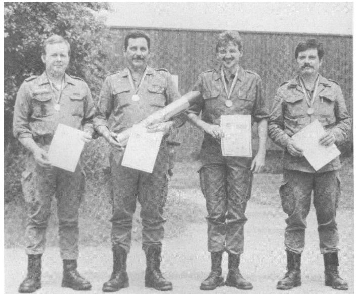
Die Siegermannschaft der RK Vaihingen mit der 8,8-cm-Kartusche.