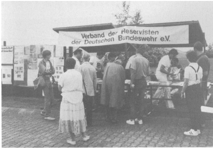
Einen Infostand beim Tag der offenen Tür der PzBrig 28 betrieb die Kreisgruppe Donau-Iller