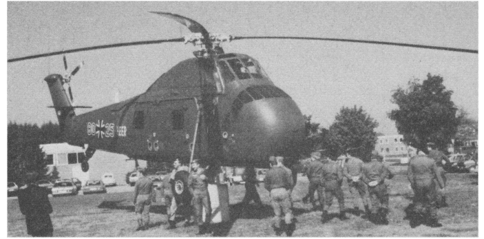
Im Mittelpunkt des Interesses: der Hubschrauber CH 53 G. Unser Foto entstand beim Besuch der Kreisgruppe Donau-Iller beim Heeresfliegerregiment 25 in Laupheim und zeigt einen Sikorsky H 34

Mit dem Resultat des Truppenbesuchs waren beide Seiten so zufrieden, daß eine Wiederholung vereinbart wurde.