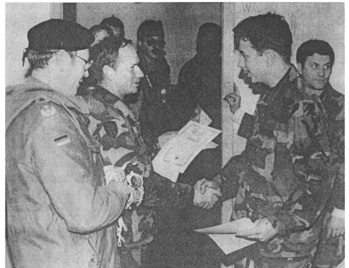
Deutsche Schützenschnüre erhielten diese US-Soldaten aus Schweinfurt und Wertheim.

Im Nachtmarsch wurden dann die letzten Kilometer überwunden, auch dabei wurden die Reservisten durch die sehr gastfreundliche Hohenloher Landbevölkerung unterstützt.