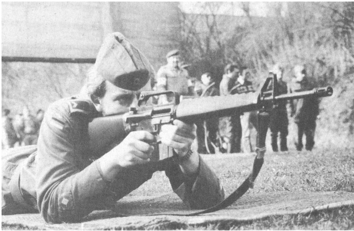
Großandrang herrschte auf der Standortschießanlage »Bernet« beim deutsch-amerikanischen Schießen um Schützenschnüre und »Expert«-Auszeichnungen.