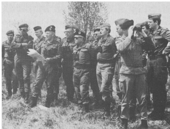
Interessierte Zuschauer: Mitglieder der ROG Stuttgart bei der 10. Panzerdivision als Beobachter beim Schießen.