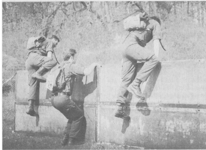
Auf der Hindernisbahn: Schnappschuß vom 10. Donau-Waffenlauf in Ulm.