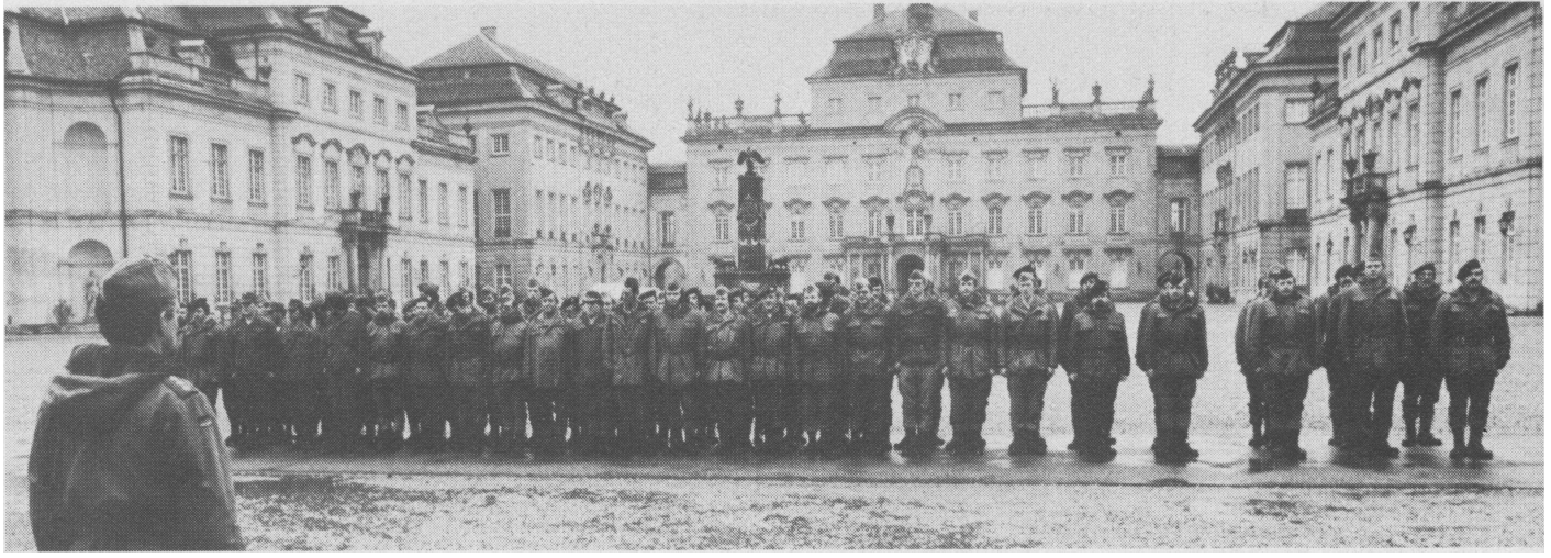
Auftakt zur Militärpatrouille im Ludwigsburger Schloß: RK-Vorsitzender Elwert vor der Front.