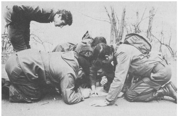
Ei — wo ist er denn, der richtige Weg? Schnappschuß von der Militärpatrouille in Ellwangen.