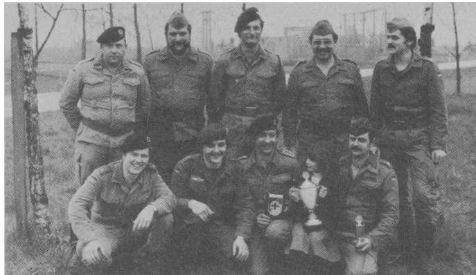
ERFOLGREICHE OFFENBURGER: Das Bild zeigt die beiden Offenburg Mannschaften, welche den ersten bzw. den sechsten Platz erreichten.