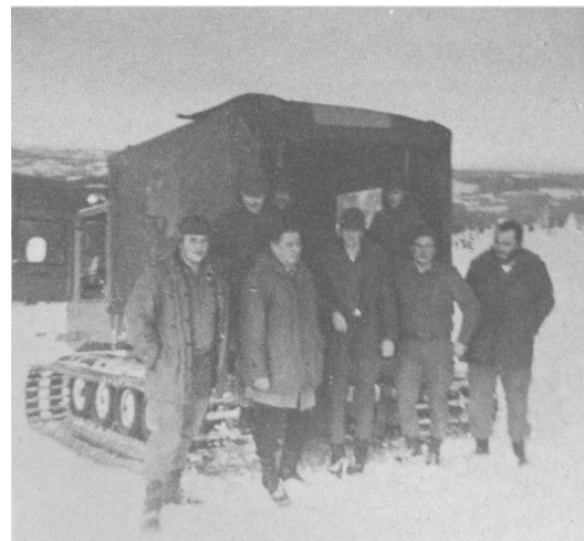
BEI DER WINTERKAMPFAUSBILDUNG im Schwarzwald (Feldberg).