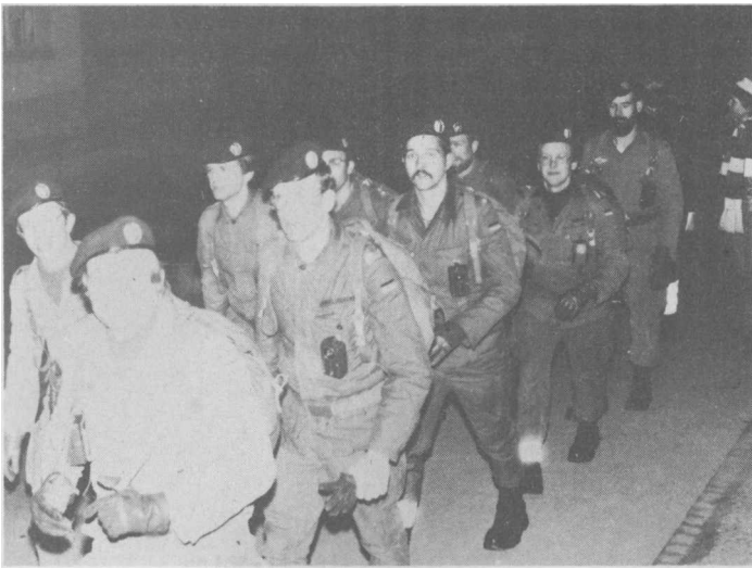
BEI SCHNEIDENDER KÄLTE unterwegs auf Berner Landstraßen: die Marschgruppe Südbaden beim 22. Berner Distanzmarsch.