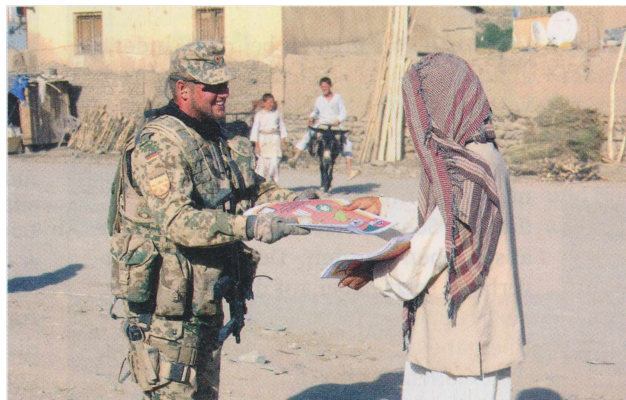
Informieren und miteinander Reden baut Gegensätze ab: Soldaten der Truppe Operative Information im Gespräch mit der Bevölkerung

Als Ziel deutscher und europäischer Sicherheitspolitik - zusammen mit den atlantischen Partnern - definierte Schwartz, Krisen und Konflikten dort zu begegnen, wo sie entstehen, um damit die negativen Auswirkungen auf Deutschland und Europa fernzuhalten. Dies gehe nicht ohne Auslandseinsätze der Bundeswehr. Dazu stellen sich Schwartz eine Reihe von entscheidenden Fragen: strategisch-politische (Welche außen- und sicherheitspolitischen Ziele hat die jeweilige Bundesregierung? Welcher Ernst steht hinter dem Ziel, einen festen Sitz im UN-Sicherheitsrat zu erringen?), Bündnispolitische (Was bedeutet Bündnisfähigkeit für Deutschland? Unter welchen Bedingungen wird