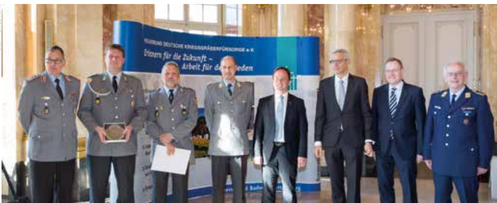
Die Ehrung der eifrigsten Sammler aus dem Jahr 2017