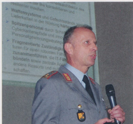
Die Rolle der Bundeswehr beim Schutz Deutschlands bei Cyber-Angriffen: Generalmajor Jürgen Setzer trägt vor, was zu tun ist

ihren Stadtwerken oder Krankenhäuser in Deutschland und England sowie einen großen Cloud Hostler gewesen, wenn man die Hacker und Erpresser gefunden hätte.