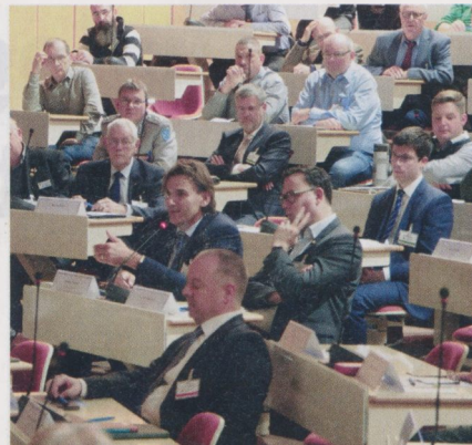
Zusammenarbeit: Polizeipräsident Andreas Stenger (zweite Reihe von links) bei der Diskussion im Großen Hörsaal zu den Gefahren aus dem Cyberraum

Setzer stellte die wesentlichen, aber vielgestaltigen Aufgaben des KdoCIR vor, wie sie im Weißbuch zur Sicherheitspolitik und zur Zukunft der Bundeswehr 2016 festgehalten sind. Da eines der wesentlichen Probleme die Gewinnung von Personal sei, zeigte Generalmajor Setzer Maßnahmen dafür auf. Ein Karrierepfad für die Fachlaufbahn Cyber/IT sei eingerichtet und Studiengänge mit Masterabschluss Cybersicherheit seien implementiert. Im Entwurf des Besoldungsstrukturenmodernisierungsgesetzes seien Zulagen für Cyberverteidigung