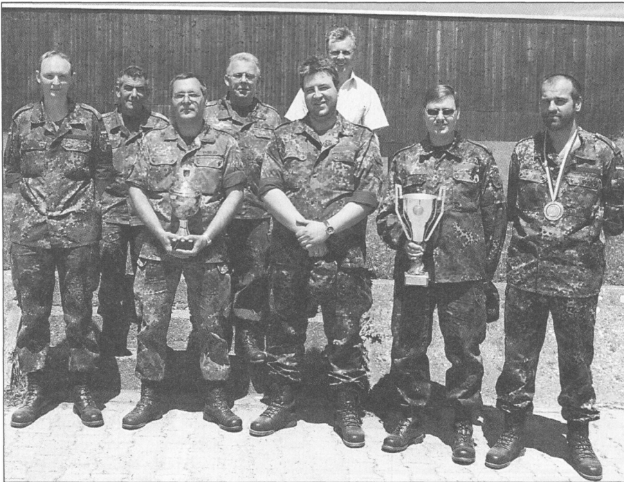
DIE SIEGREICHEN Schützen des Qualifikations-Schießens und des Super-Cup auf der Standortschießanlage Sigmaringen.