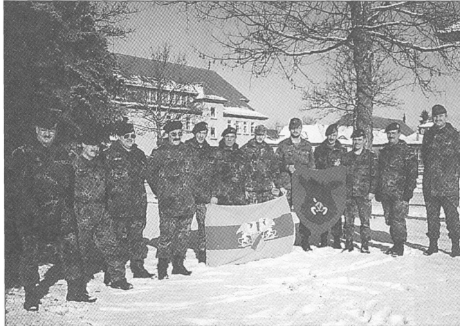
NACH DEM ENDE der Ausbildung stellten sich die »Badischen Jäger« zu einem Erinnerungsfoto.

Am folgenden Tag fand eine Waffenausbildung an den für