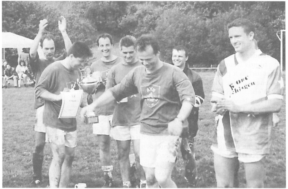
STOLZ ÜBER den Turniererfolg: Die Mannschaft des Aktiven Vereins für Hobby und Freizeit.