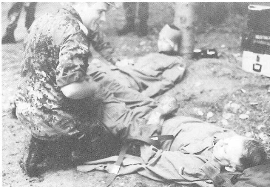
REALITÄTSNAH war die Station »Sanitätsdienst und Selbst- und Kameradenhilfe« gestaltet.

Insgesamt waren 17 Mannschaften bei idealem Wettkampfwetter auf die rund zwölf Kilometer lange Strecke des »Badischen Jägers« gegangen. Unter diesem Namen stand der Landeswettkampf '99, den das Verteidigungsbezirkskommando 52 (Karlsruhe) mit seinem Kommandeur, Oberst Rudolf Gundlach, vorbildlich vorbereitet hatte. Tatkräftig unterstützt wurde das Kommando durch die Landesgrup-