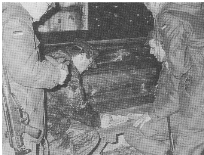
Marschieren und orientieren bringen bei Nacht besondere Probleme. Hier ermittelt eine Marschgruppe den nächsten Anlaufpunkt.

Entscheidend aber sei auch, daß die Bundeswehr die Mitglieder des Verbandes nicht nur als potentielle Soldaten sieht, sondern als Mittler zwischen Armee und Bevölkerung. So sollte jeder Reservist sein Engagement für die Bundeswehr glaubhaft begründen und sachgerecht über die Bundeswehr und verteidigungspolitische Interessen der Bundesrepublik Deutschland berichten können.