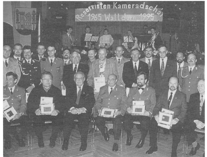
Ehrungen zahlreicher verdienstvoller Mitglieder standen im Mittelpunkt der Feierlichkeiten zum 30jährigen Bestehen der RK Walldürn.