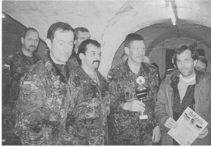
Mannschaftssieger beim 5. Oberschwabenmarsch der Kreisgruppe Bodensee-Oberschwaben-Süd wurde die RK Ertingen I mit 1 330 Zählern vor der RK Argenbühl und Senden.