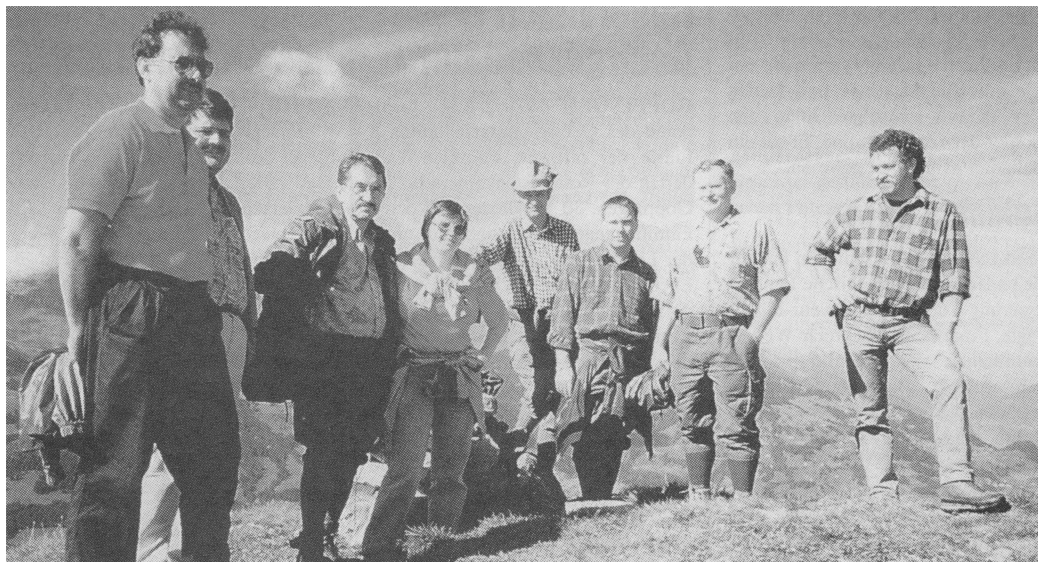
Als Gipfelstürmer entpuppten sich die Angehörigen des Reserve-Unteroffizierscorps aus Reutlingen auf dem »Gonzen« in der Schweizer Bergwelt. Mit einer kleinen Delegation nahmen sie an der Herbstübung der Schweizer Fouriere teil. Außerdem besichtigten sie in St. Margarethen eine Kasernenanlage im Hellsberg untertage. In diesem Jahr kommen die Eidgenossen nach Württemberg.