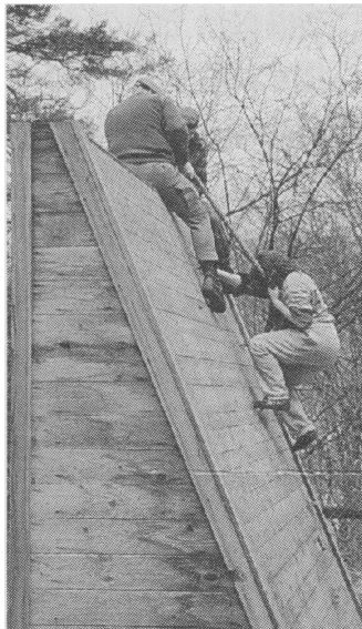
Auch die teilnehmenden Damen mußten beim zivil-militärischen Wettkampf in Immendingen über die Hindernisbahn. Drei Damenteams gehörten zu den 47 teilnehmenden Mannschaften.