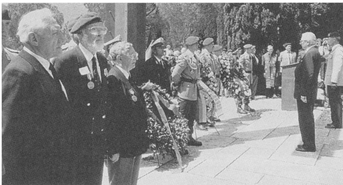
Soldaten und Veteranen aus vier Nationen kamen bei den Gedenkfeiern vor dem Monte Cassino zusammen. Die deutsche Delegation wurde von Soldaten aus Nagold und Bruchsal bestimmt, für Fallschirmjäger-General Fritz Eckert war es der letzte Auslandseinsatz.