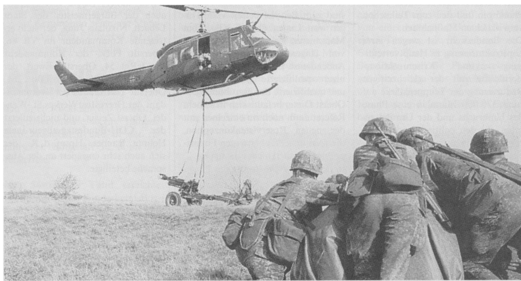
Beim Manöver des Eurokorps ging es auch sprachlich europäisch zu. Das in Straßburg beheimatete Korps übte beim Test »Pegasus« mit den Stäben im Süden Baden-Württembergs. Der Korpsstab bezog mit der Übungsleitung in Stetten am Kalten Markt Quartier.

Verantwortlich für »AKTIV aktuell«: Horst Pieper, Am Schillbach 9, 75223 Niefern-Öschelbronn, Tel. 0 72 33 / 32 92 pr. und 0 72 31 / 3 2001 di. (Chefredaktion Pforzheimer Zeitung). Manuskripte bitte an die Bezirkspressereferenten.