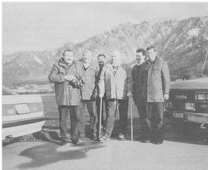
Das Alpenpanorama bildete die Kulisse beim Besuch der Reutlinger Unteroffiziere bei den Schweizer Furieren. Nach einem Schießen sahen sich Gastgeber und Gäste die Region um die Stadt Chur an.