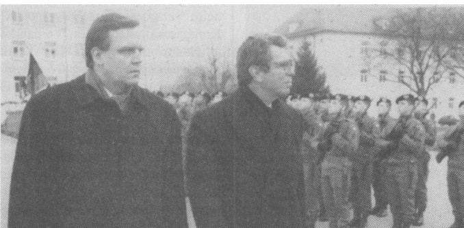
Einen gemeinsamen Besuch haben Bundesverteidigungsminister Volker Rühle (links) und der bisherige französische Amtskollege Pierre Joxe bei der deutsch-französischen Brigade in Müllheim absolviert. Sie schritten eine Ehrenformation ab.

Die noch im Aufbau befindliche Brigade, Kern des künftigen Eurokorps, soll an den Standorten Müllheim, Donaueschingen und Immen dingen zusammen über 4 200 Soldaten verfügen und den Kern des Straßburger Korps bilden.