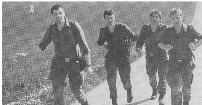
Ganz schön kräftezehrend waren die Kilometer von den Höhen der Schwäbischen Alb hinab in die Donau-Niederungen in Ulm. Bei 30 Grad wurde der 20. Donau-Waffenlauf für die Teilnehmer aus fünf Nationen zu einem schweißtreibenden Jubiläum. Die beste Mannschaft kam aus Heuberg.