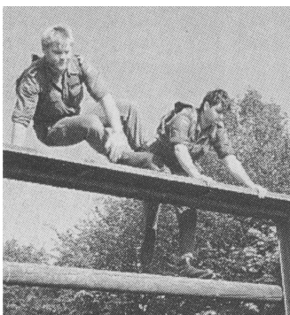
An der Eskaladierwand zeigten die Teilnehmer des 20. Donau-Waffenlaufes ihre Fitness. Erstmals führte der Marsch durch die Stadt Ulm.