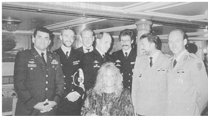
Das italienische Segelschulschiff »Amerigo Vespucci« besuchte eine Delegation des Arbeitskreises Reserveoffiziere Freiburg auf Einladung der italienischen Marine. Kameraden aus Hamburg und aktive Offiziere der Bonner US-Botschaft verstärkten die Freiburger Gruppe beim Besuch an Bord.