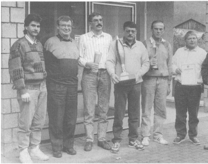
Pokale und Urkunden gab es für die besten Mannschaften und Einzelschützen beim siebten Fernschießwettkampf der RK Geislingen.